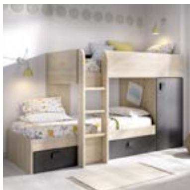
MONTAJE OPCIÓN A: