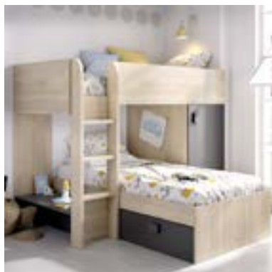
MONTAJE OPCIÓN B: